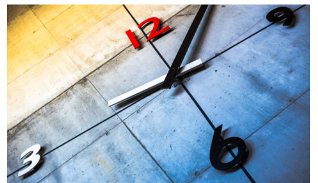
Arbeidstidsforkorting: Rødt har fått gjennomslag for et forsøk med sekstimersdag i Oslo.