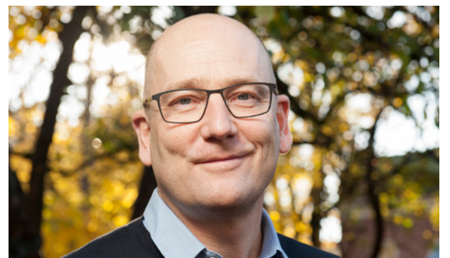
Leder i Utdanningsforbundet: Steffen Handal.

Han er ikke imponert over måten KS har møtt de streikende på, men spiller ballen videre til politisk