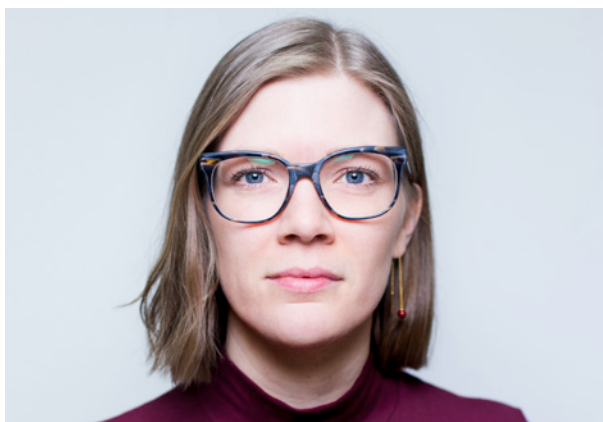
Rødt-nestleder: Marie Sneve Martinussen.

– Jeg frykter rente-baksmell for norsk økonomi. Når renta økes så mye så fort bidrar det til høyere arbeidsledighet. Da er det de som har minst som rammes dobbelt, det er de som har vanskeligst for å takle høye renter i seg selv og som mister jobben først når ledigheten øker, legger hun til.