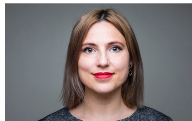
Stortingetsrepresentant: Sofie Marhaug.

– Jonas Gahr Støre og Olje- og energiminister Terje Aasland har gjentatt til det kjedsommelige at markedet har tjent oss godt. Vi mener Arbeiderpartiet må endre politikk fra dagens markedsliberalisme til politisk kontroll over krafta,