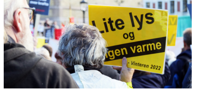
Belastning: De høye strømprisene er en stor belastning for de med dårligst råd.