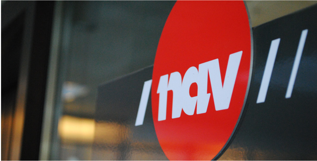
Trenger hjelp: Mange av de som sitter nederst ved bordet går en tøff vinter i møte.