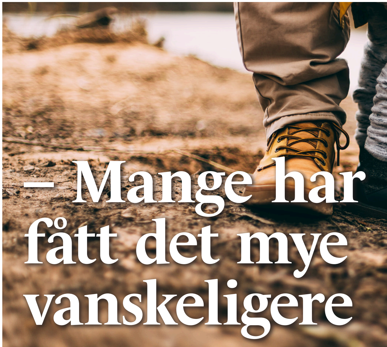
Vanskelig: Antallet barn som vokser opp i familier med vedvarende lav inntekt øker.

ISSN: 1504-7660 (avis) 1504-7679 (pdf) Trykkeri: Nr1Trykk Utgiver: Rødt Dronningens gate 22 0154 Oslo